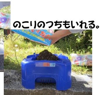
のこりのつちもいれる。