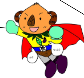
京田辺のヒーロー ぎょくろマン