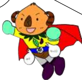
京田辺のヒーロー ギョクロマン